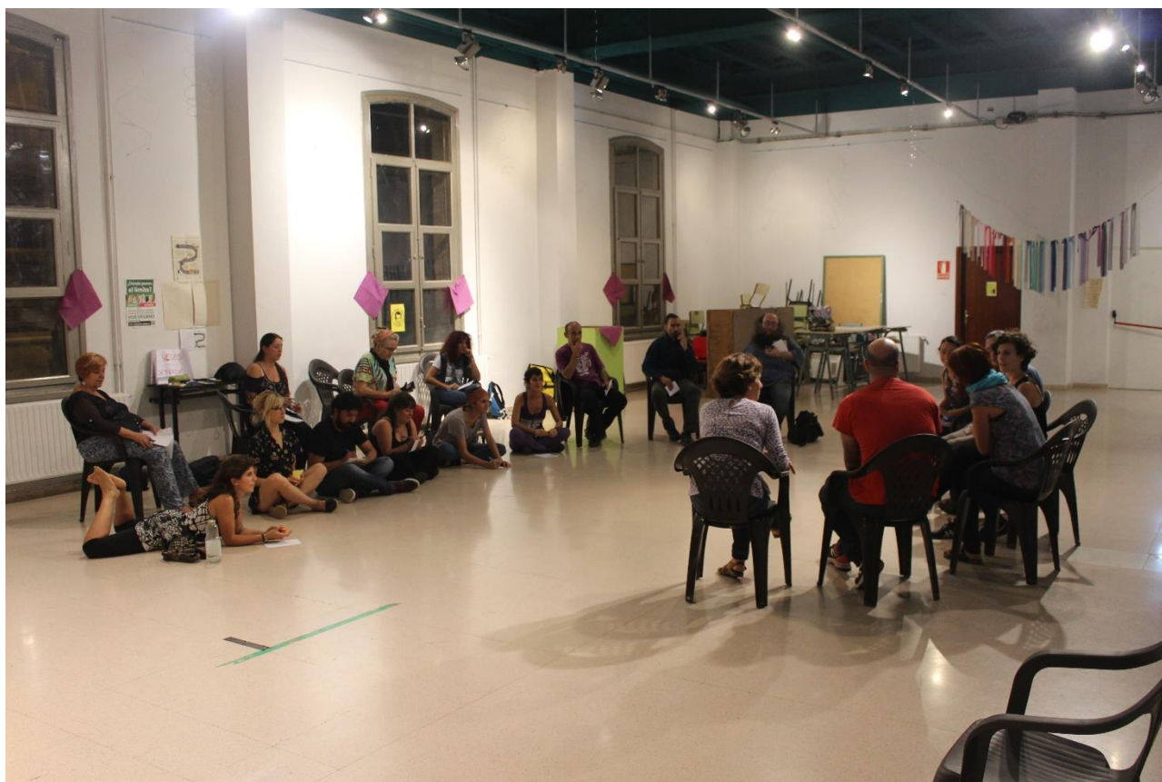
Ilustración 21. Dinámica. Acción taller cómo cuidarnos en colectivo