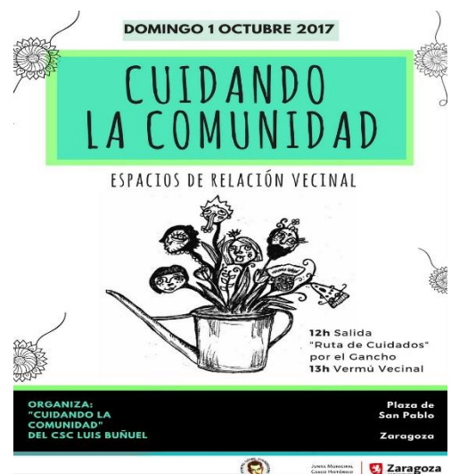
Ilustración 7. Cartel Ruta de cuidados

El día 1 de octubre, celebramos una Ruta de Cuidados . Nuestro objetivo era visitar espacios y personas que son cuidadores del barrio. Convocamos a las personas a acompañarnos a un recorrido por el barrio. Se trata de un recorrido simbólico, ya que no podríamos visitar todos los que quisiéramos, así que optamos por seleccionar tres ejemplos: