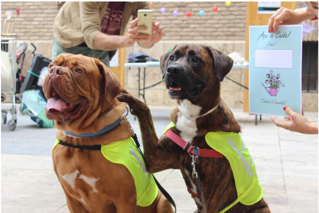
Ilustración 13. Perros cuidadores. Encuentro vecinal Cuidando la Comunidad