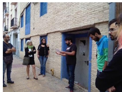
Ilustración 10. Narrando historia de cuidados vecinales. Acción ruta de cuidados

La historia de una mujer que cuida: pedimos a un vecino del barrio que nos leyera la historia recogida por las compañeras del Centro de Salud de San Pablo de una vecina que lleva toda la vida cuidando a su familia. Quisimos homenajear a las mujeres cuidadoras, sostén de la vida y las personas. Leímos la historia en la puerta de una casa, una casa que podría ser la de cualquiera de nosotras, para simbolizar que los cuidados son esenciales en todos los hogares.