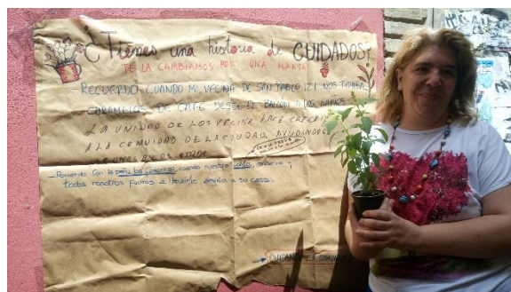
Ilustración 4. Vecina con planta. Acción plantas por historias de cuidados

Para más info. Véase Historias de vecinas y vecinos