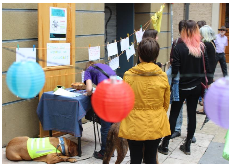
Ilustración 24. Tendedero de historia de cuidados vecinales.

Salir a la calle a buscar historias de cuidados ha resultado ser una iniciativa muy interesante. No sólo porque al preguntar por las vidas cotidianas y por los cuidados que hacen sostenible la vida ya estamos dando valor a los cuidados, sino porque hemos observado que la mayoría de veces las personas protagonistas de los cuidados no son conscientes de la importancia que tienen sus actos para la vida de otras personas y para la comunidad-barrio. Esto lo observamos con mayor frecuencia en las mujeres. El rol tradicional femenino implica los cuidados, por ello se tienden a vivir como algo “natural que hay que hacer”, sin valorar el esfuerzo que supone ni lo que implica a nivel social y económico.