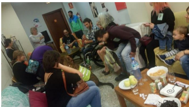
Ilustración 8. Sala de estar Centro Alba. Acción ruta de cuidados