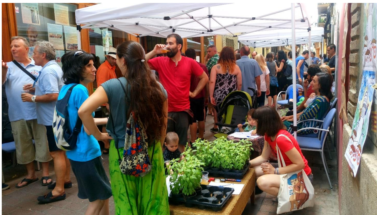
Ilustración 5. Acción plantas por historias de cuidados