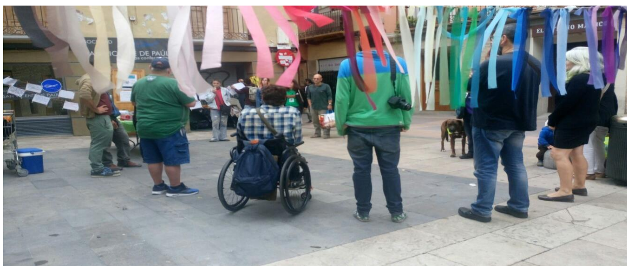
Ilustración 16. Final de la ruta. Acción ruta de cuidados