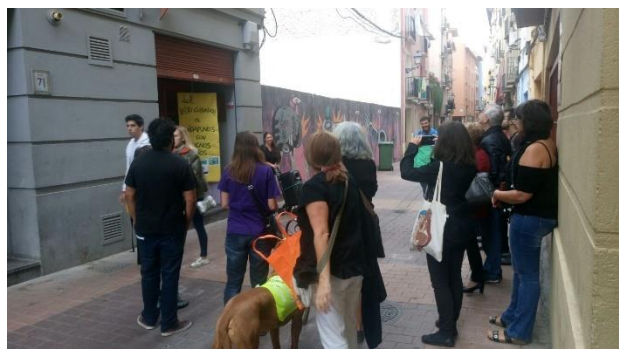
Ilustración 9. Llegando al Centro Alba. Acción ruta de cuidados

El Centro Alba: esta entidad, que lleva más de 25 años trabajando en el barrio, fue la elegida para “representar” los diferentes proyectos que existen en el barrio que aportan servicios y cuidados a las personas. El Centro Alba es un espacio donde las personas es lo más importante, donde puedes ir a estar, donde eres acogida y escuchada. Nos recibieron con las puertas abiertas para contarnos sobre sus haceres y saberes, y pudimos conversar con las protagonistas de este bonito lugar.