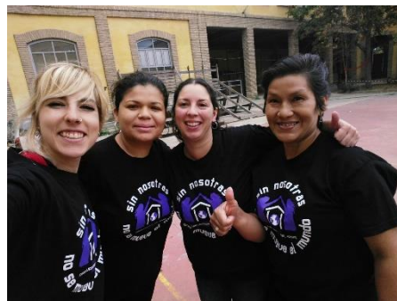
Ilustración 12. Componentes de colectivo de Trabajadoras del Hogar y del Grupo Cuidando la Comunidad. Acción ruta de cuidados