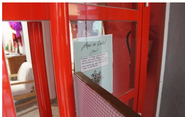
Ilustración 15. Cartel de espacio cuidador. Centro Alba.

Finalizamos la ruta con un encuentro vecinal en la plaza San Pablo en el que compartimos un picoteo y pudimos disfrutar de un tiempo para estar sin hacer y para conocernos desde un ambiente lúdico e informal. Colocamos el tendedero de historias de cuidados para continuar recopilando historias. Muchas de las conversaciones que tuvimos en la plaza versaron sobre las relaciones de cuidados.