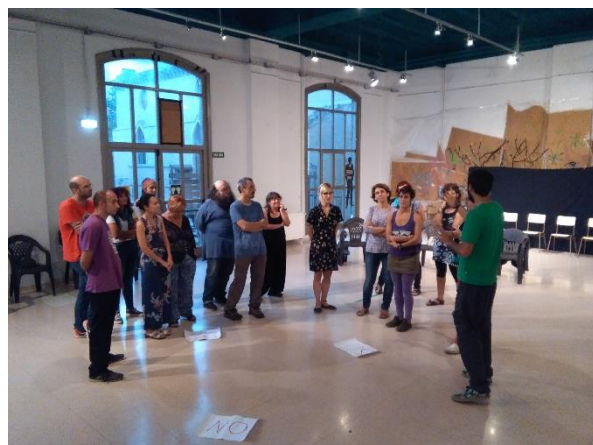
Ilustración 18. Bienvenida e inicio. Acción taller cómo cuidarnos en colectivo

Al taller acudieron 16 personas, la mayoría vinculadas a otros proyectos colectivos. Se generó un clima distendido que favorecía la participación. Se sentían y observaban las ganas de compartir experiencias personales en torno a los cuidados.