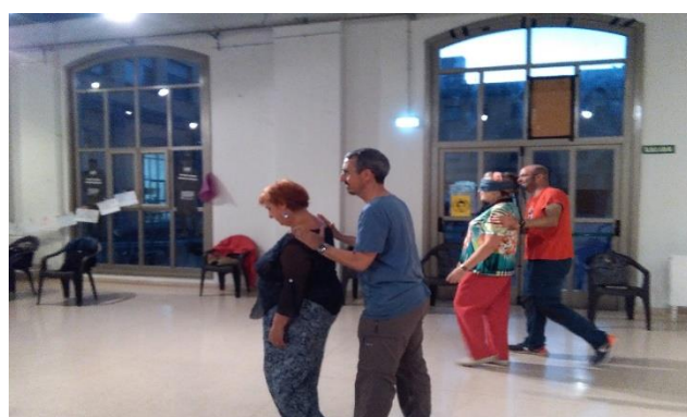
Ilustración 20. Dinámica. Acción taller cómo cuidarnos en colectivo

A nivel colectivo, diversas voces expresaron que a menudo los espacios que se autodenominan como alternativos y transformadores hablan de cuidados, pero no los llevan a la práctica desde las relaciones.