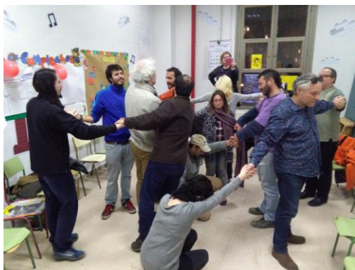
Ilustración 1. Dinámica de asamblea de cuidados