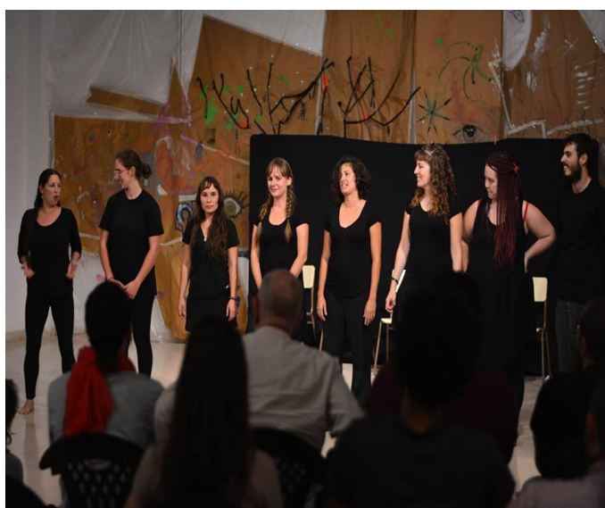
Ilustración 22. Actuación teatro espontáneo. Acción taller cómo cuidarnos en colectivo

En esta ocasión quisimos darle un tema al espectáculo, y pedimos a las personas que acudieron a ver el espectáculo que compartieran sus historias de cuidados. Así, pudimos ver en el escenario las historia que las vecinas y vecinos querían contar, dando un lugar visible y protagonista a los cuidados.