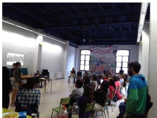
Ilustración 11. Asamblea del Colectivo Trabajadoras del Hogar. Acción ruta de cuidados

El colectivo de Trabajadoras del Hogar: nos acercamos al Buñuel a encontrarnos con las mujeres que forman parte de esta iniciativa que pretende poner en valor el trabajo doméstico y reivindicar sus derechos laborales. Nos contaron cómo se organizan y cuidan, y nos hablaron sobre sus principales reivindicaciones.