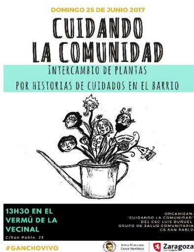
Ilustración 23. Cartel Encuentro vecinal Cuidando la Comunidad.

Hemos querido salir a la calle a preguntar a las personas del barrio por sus historias de cuidados. Nuestra idea era ir donde está la gente, acudir a los espacios de socialización cotidianos. Son historias sencillas, que suceden a diario, que forman parte de las redes entre vecinas y vecinos, que nos ayudan y nos hacen sentir bien. Historias que pasan desapercibidas y que queremos visibilizar, ya que tejen relaciones de cuidados en nuestros barrios.