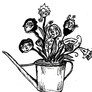
Ilustración 3. Imagen de Cuidando la Comunidad.

La imagen de este proyecto es una regadera que hace de macetero en el cual nacen plantas con caras de personas, simbolismo de los cuidados. Nos pareció que la idea de la regadera representa la noción de cuidados, porque las relaciones es algo que hay que regar, con cariño. Las plantas salen de la misma regadera y cada una es diversa y libre, pero compartiendo raíz, metáfora de la interdependencia entre personas que defendemos. Está dibujado a mano, sobre el papel, porque así adquiere un toque cálido y porque la imperfección es bella.