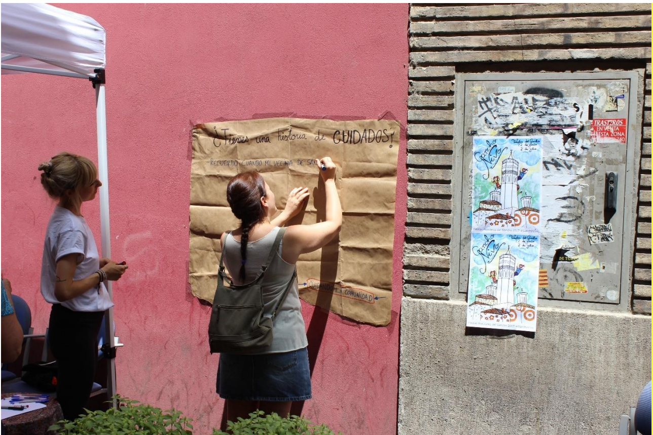
Ilustración 6. Recogiendo historias de cuidados vecinales. Acción plantas por historias de cuidados