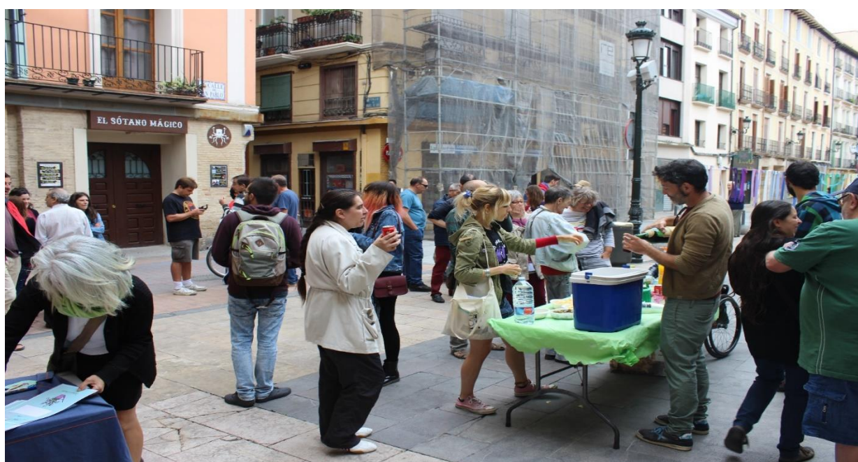
Ilustración 17. Vermú vecinal. Acción ruta de cuidados